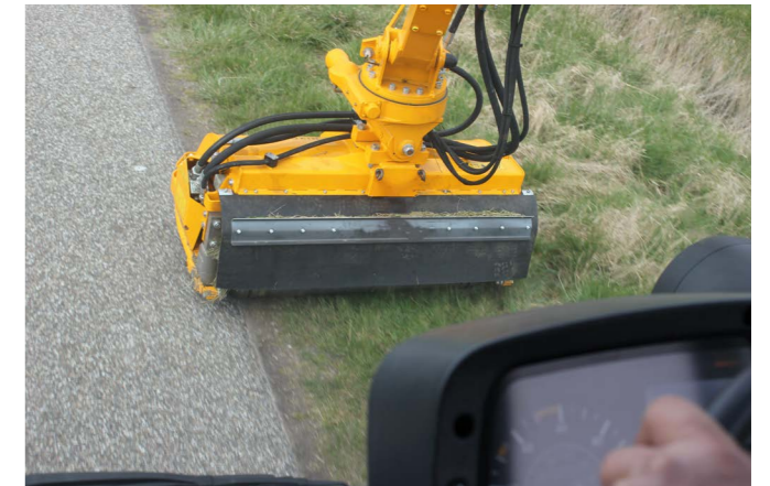
Vanuit de cabine een goed zicht op het werk.