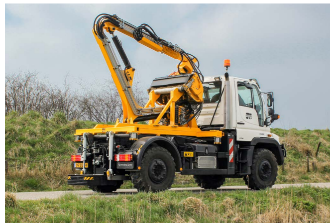
De Musketier-Y in transportstand.

De Musketier-Y wordt standaard geleverd met een tweedelig giekensysteem. De machine heeft daardoor een bereik van ca. 7 meter vanuit het hart van het voertuig. Werkzaamheden kunnen zowel links als rechts van het voertuig uitgevoerd worden, waarbij u altijd het maximale zicht heeft over de werkzaamheden. Bovendien is de machinist verzekerd van het comfort van Nivotronic.