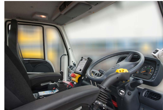
Overzichtelijke display verhoogt het comfort en de veiligheid.