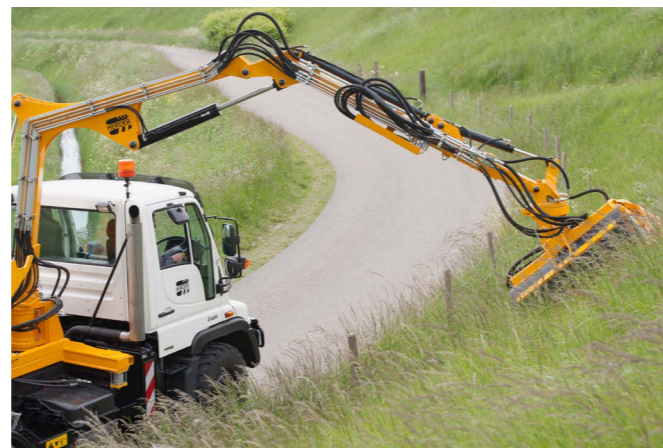
Links of rechts werken met een bereik van ca. 7 meter.